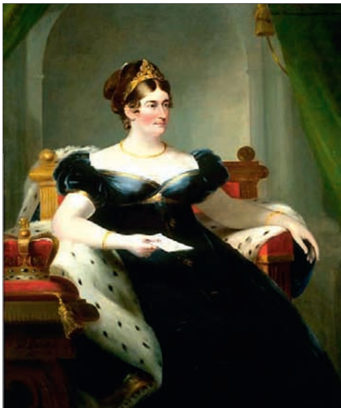
Caroline von Braunschweig, Königin von England, 1820.

Institut für Braunschweigische Regionalgeschichte und Präsident des Vereins Rettung Schloß Blankenburg e.V.