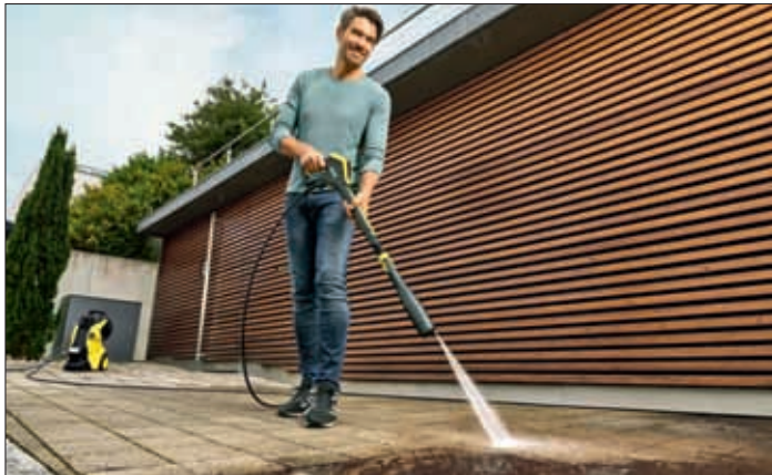
Hochdruckreiniger sorgen für saubere Verhältnisse.

(dj-d-k). Rund ums Haus sorgen Hochdruckreiniger schnell und effizient wieder für saubere Verhältnisse. Bei der Leistungskraft der Geräte liegen die Unterschiede allerdings im Detail. Die unabhängige SLG Prüf- und Zertifizierungs GmbH hat jetzt in Labortests die Wirkung untersucht. Demnach weisen etwa die Hochdruckreiniger der Klasse K5 von Kärcher den breitesten und somit effizientesten Reinigungsstrahl auf. Die Testsieger sind von der Auto- bis zur Terrassenreinigung für anspruchsvolle Anwendungen konzipiert. Die robuste Pumpe mit Aluminiumkomponenten sorgt für einen maximalen Wasserdruck von 145 bar, der Antrieb mit wassergekühlten Elektromotoren ermöglicht einen ruhigeren Lauf, eine höhere Lebensdauer und einen geringeren Energiebedarf im Vergleich zu einem luftgekühlten Antrieb.