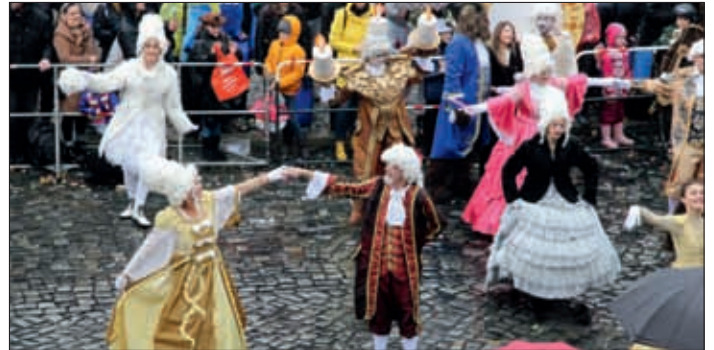
Buntes Treiben in Braunschweig.