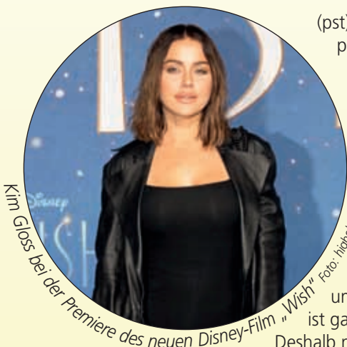
Kim Gloss bei der Premiere des neuen Disney-Film „Wish“