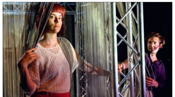
Forever Yours oder Die Leiden des jungen Werther, Lessingtheater.

11:00 Uhr Forever Yours oder Die Leiden des jungen Werther, Lessingtheater, WF 20:00 Uhr Heinz Strunk, Westand, BS