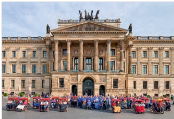
Projektbeteiligte von Radeln ohne Alter feierten vorm Schloss 18.200 geradelte Kilometer.