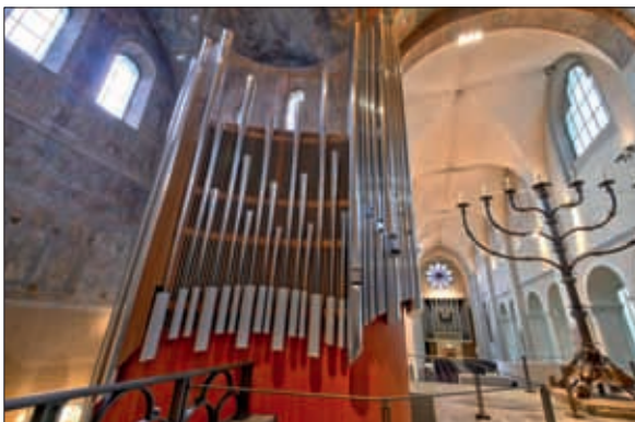
Die neue Chororgel.