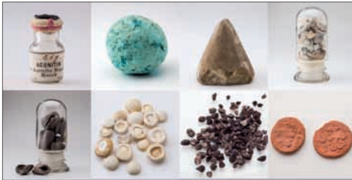
Exponate im historischen "Alchemielabor".

Die Teilnahme ist kostenlos. Anmeldung und Infos: https://forum-industriekultur.de/veranstaltungen