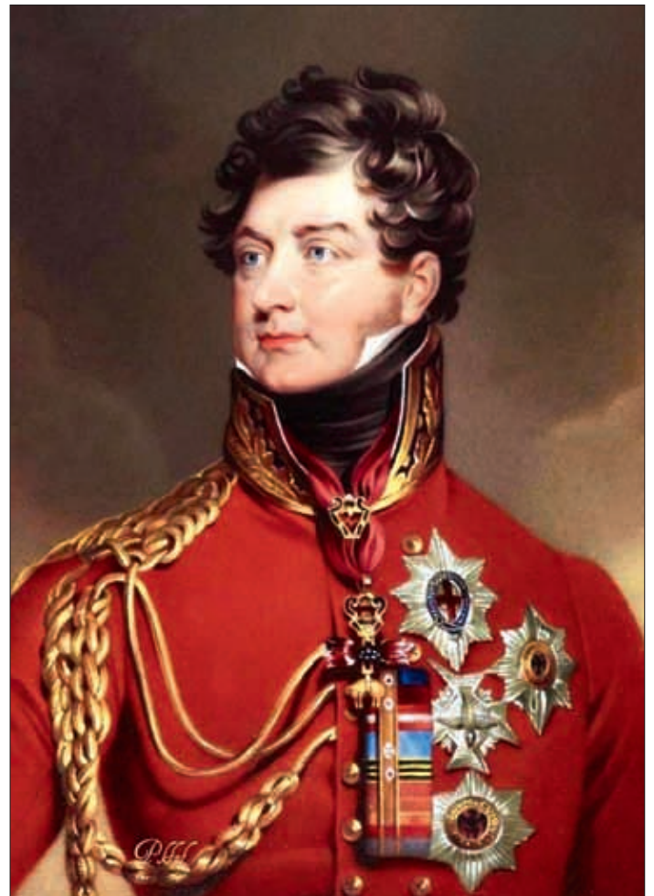
Georg IV. König von England, 1810.

Caroline von England, Prinzessin von Braunschweig, war eine selbstbewusste Frau. Sie verteidigte bis zuletzt ihr Recht auf Bildung, forderte ihr Recht auf Liebe und wollte ihr Recht auf ihre Tochter nicht preisgeben. Die Literatur feierte sie als königliche Feministin, das endgültige Urteil aber ist sehr viel diffiziler und vielschichtiger. Am besten hat die Tochter Charlotte das Verhältnis der Eltern charakterisiert, als sie meinte: »Meine Mutter ist schlecht; sie wäre aber nicht so schlecht, wenn mein Vater nicht noch viel schlechter wäre«.