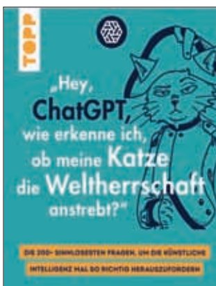
„Hey, ChatGPT, wie erkenne ich, ob meine Katze die Weltherrschaft anstrebt?“ Buch, 208 Seiten frechverlag, Preis: 12,00 € ISBN: 978-3-7358-5202-1

Und das schreibt ChatGPT selbst über „sein“ Buch: